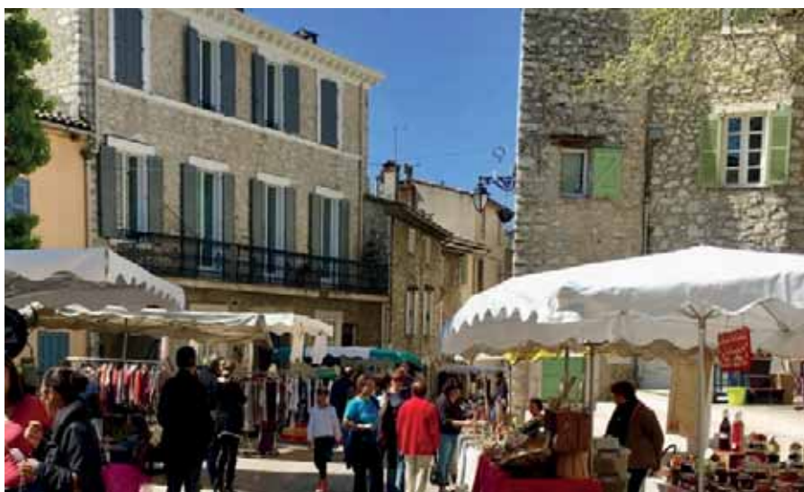
La Colle sur Loup et ses rues fourmillent d'artisans.

La mairie a décidé de soutenir l'activité artisanale par le biais d'une communication digitale qui vise à la mettre en valeur. Le partenariat avec la CMAR Provence-Alpes-Côte d'Azur a permis à 100 % de ces entreprises artisanales locales de soutenir un développement en communication numérique.