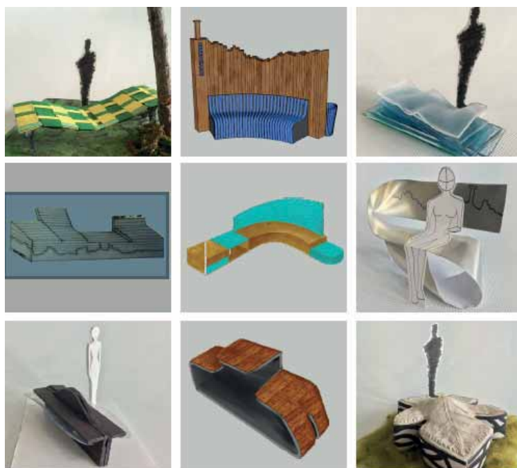
Les 9 projets de bancs publics