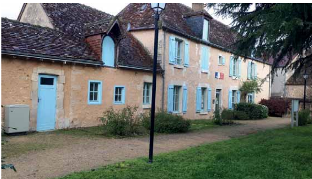
Mairie de Vicq sur Gartempe

Afin de valoriser l'installation de nouvelles entreprises artisanales dans la commune, les locaux de l'ancienne poste ont été réhabilités en 2018 pour accueillir la biscuiterie artisanale : Serenity Biscuits : une petite entreprise artisanale qui a fait le choix de revenir vers une consommation raisonnable et responsable, en privilégiant les circuits courts, et la mise en avant des produits locaux qui l'entourent. Également, la commune met à disposition des salles pour des ateliers de calligraphies par exemple pour que les habitants découvrent des métiers de l'artisanat.