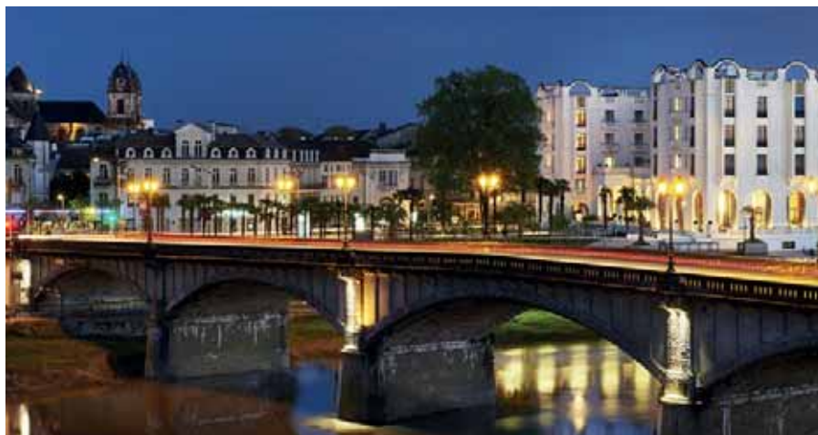
Dax de nuit

Les artisans actuels des halles sont particulièrement accompagnés durant les travaux : continuité commerciale dans une halle transitoire, loyer gratuit, campagne de communication et d'image.