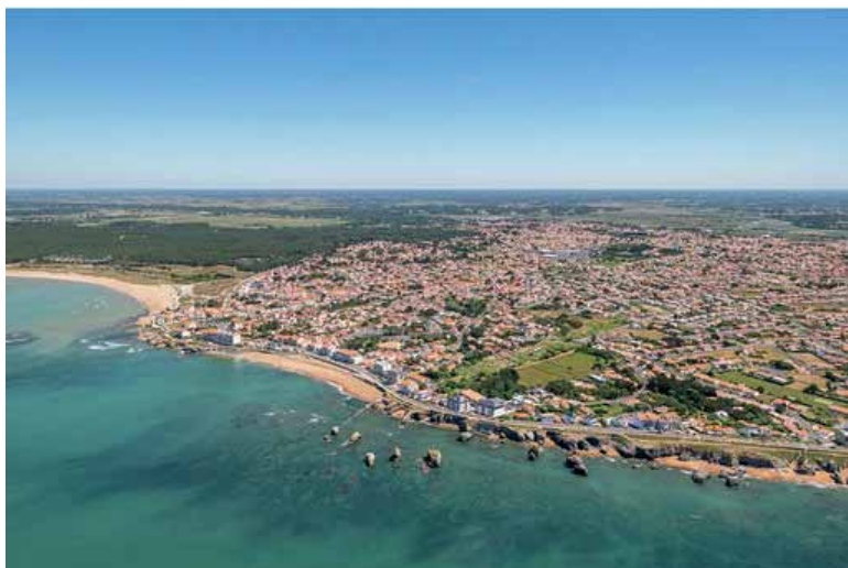
Vue aérienne de Saint Hilaire de Riez

Cette initiative innovante, de partenariat gagnant-gagnant entre une Collectivité et les artisans boulangers, vise à garantir une offre qualitative à destination des plus jeunes du territoire. Il s'agit également d'initier et d'encourager l'adaptation aux changements de comportement des consommateurs par une nouvelle offre bio et de proximité.