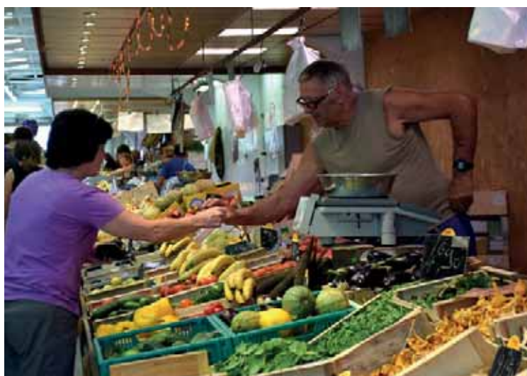
Marché de Neuilly-Plaisance