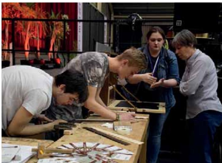
Salon de l'artisanat 2018

Pour faciliter l'accès au centre-ville, impacté par des travaux, la mairie a instauré un service original de voiturier gratuit devant la mairie, tous les jeudis et dimanche de 9h à 13h. En parallèle, la commune a instauré un périmètre de sauvegarde du commerce et de l'artisanat de proximité afin de pouvoir exercer un droit de préemption. Après ceci, un appel à candidature est constitué avec la demande d'un cahier des charges strict. Ensuite, la commune rétrocède les espaces préemptés aux commerces choisis.