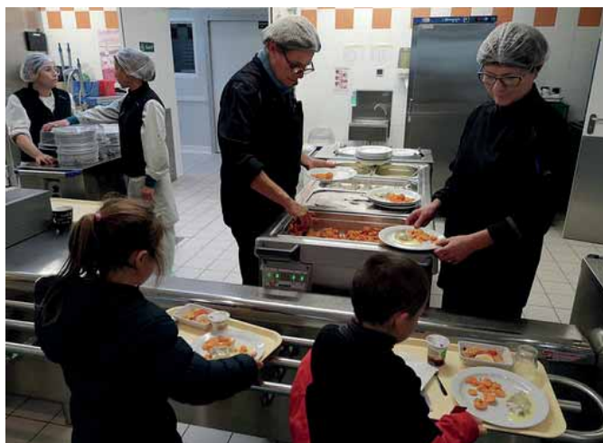
Le restaurant scolaire de Saint Hilaire de Riez se met au bio local.